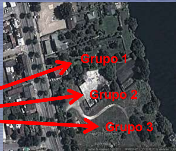
Sitio 5 Valdivia