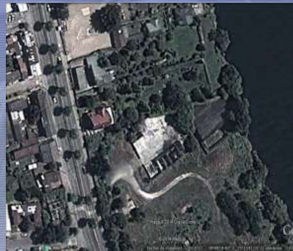
Sitio 5 Valdivia